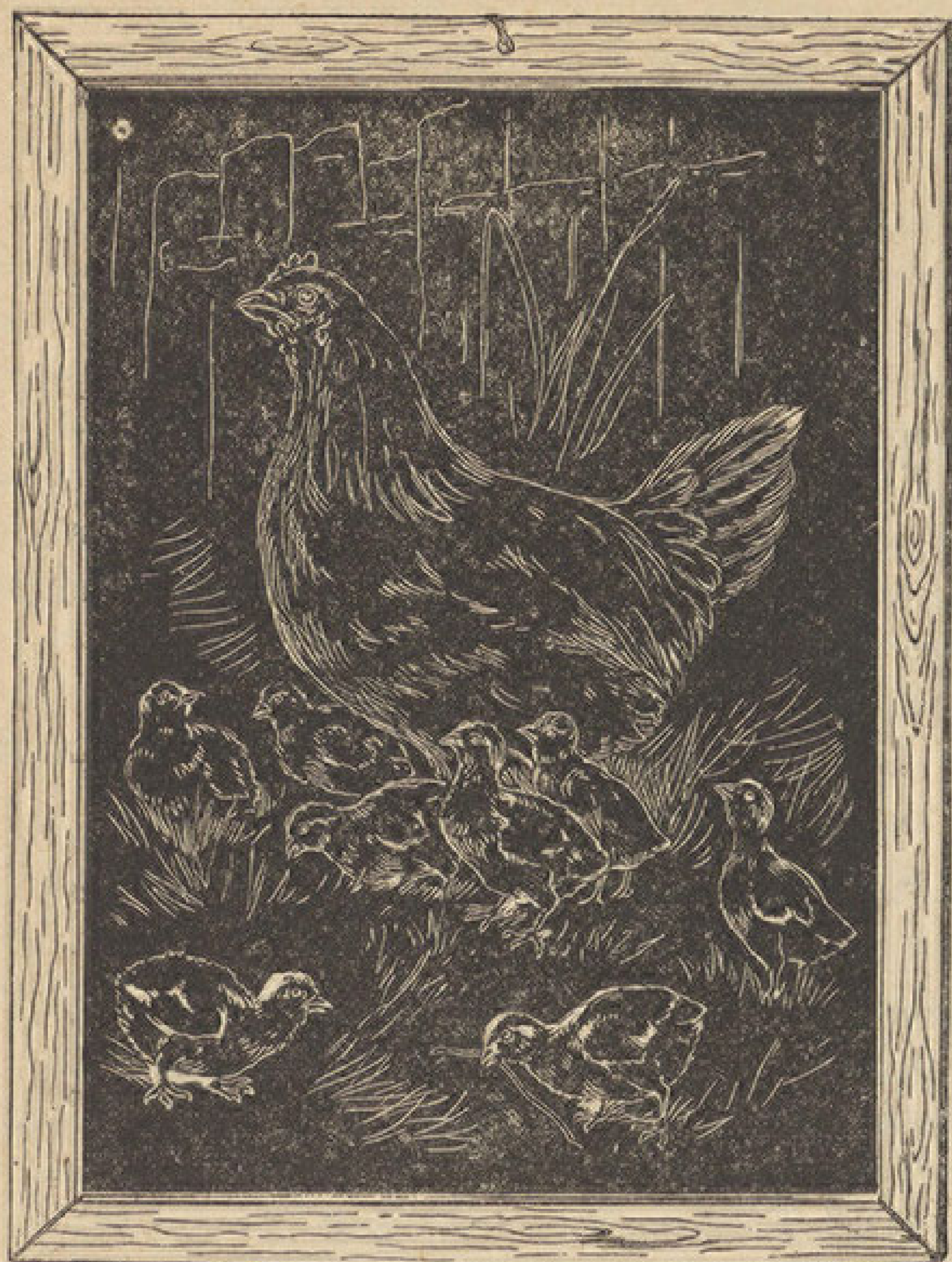
Нашим малим цртачима за прецртавање на таблици.