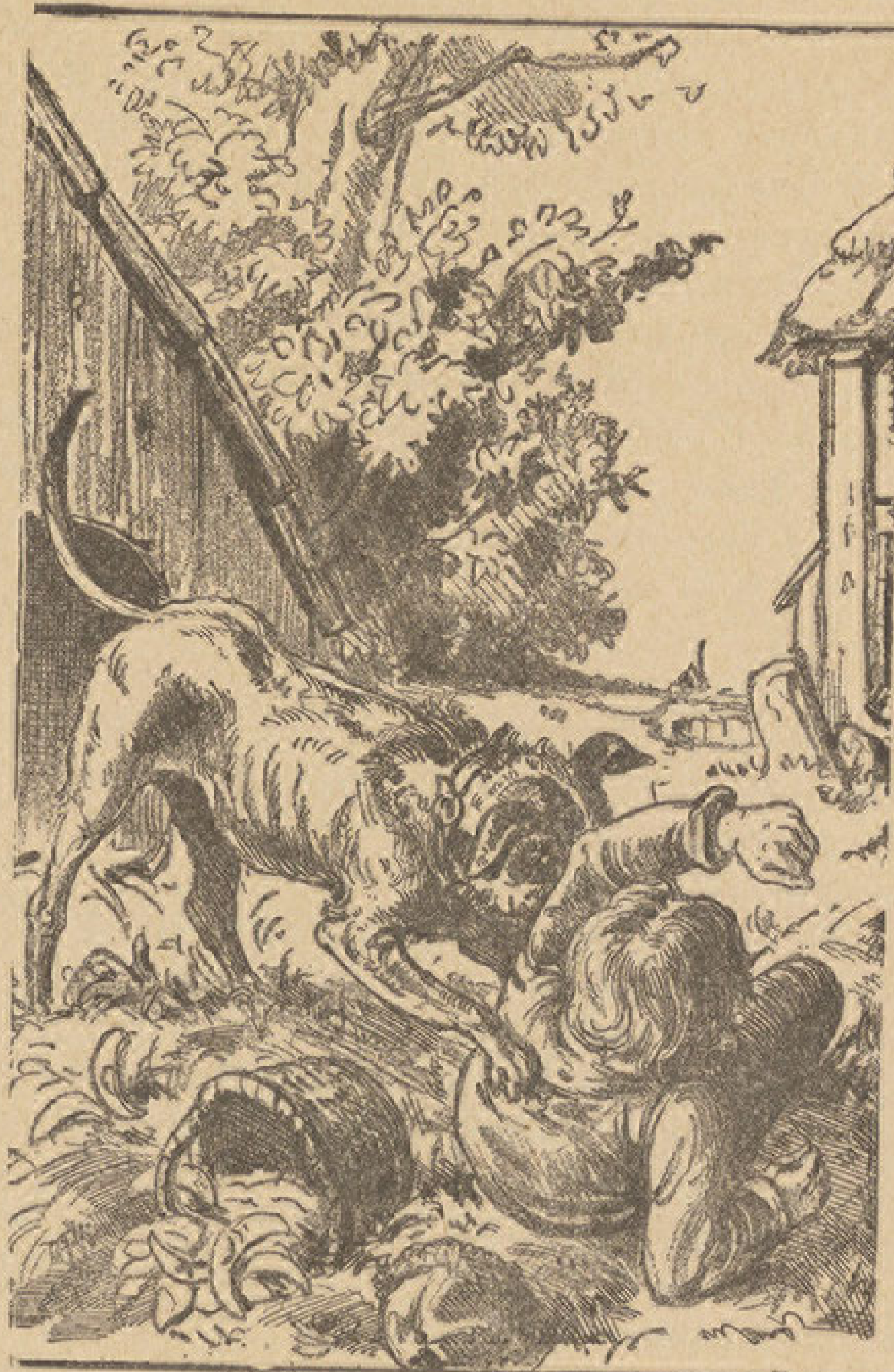
Не дражи пса. (Види опис на стр. 311.)