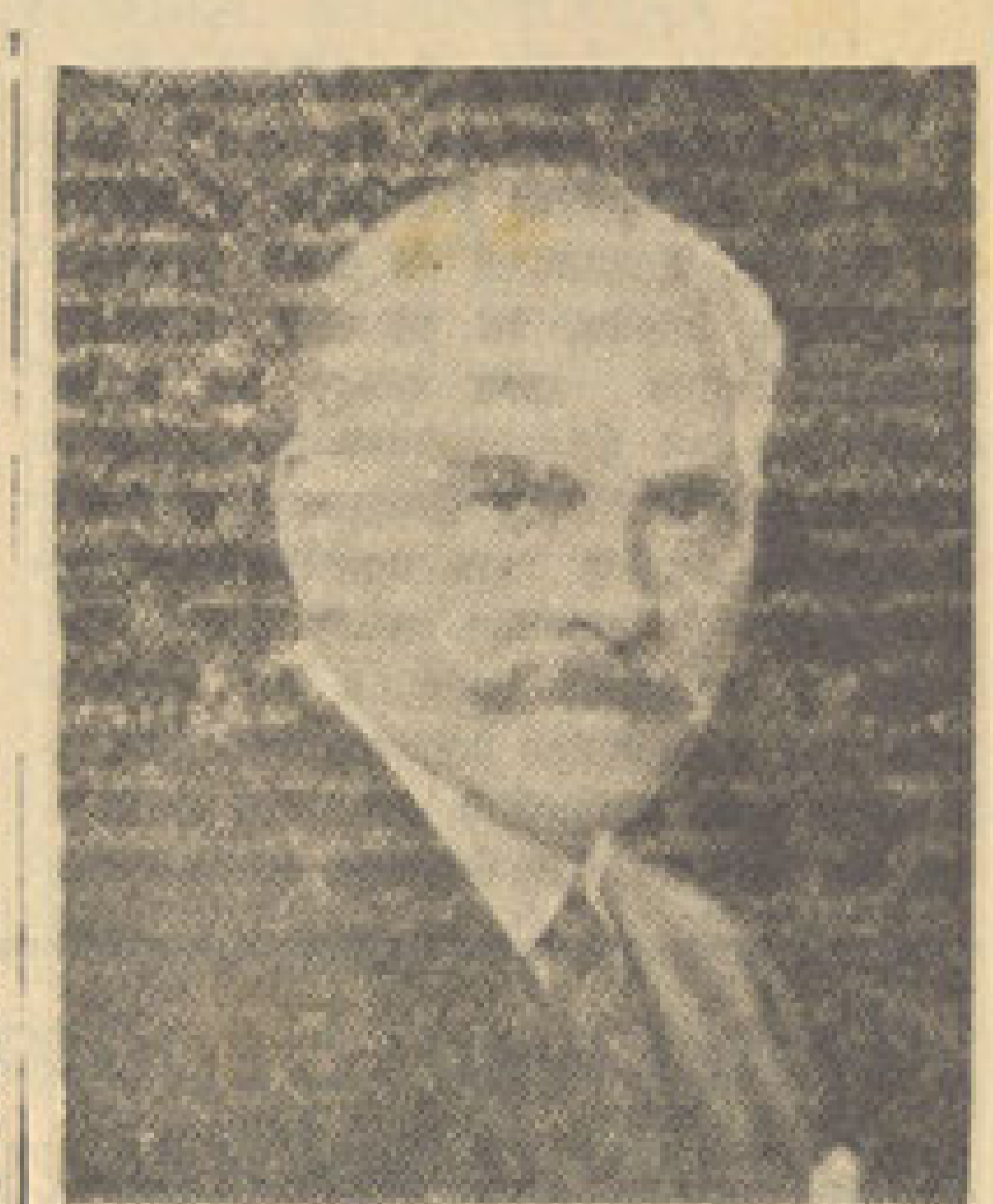
Председник владе г. д-р Калаи

— Ако сада у првом реду онај рад који тече на линији спољно-политичкој и војној. О томе широка маса скоро ништа не зна, но по природи саме ствари, другачије то и не може бити, међутим су то две кардиналне тачке вођства, питања о бити или не