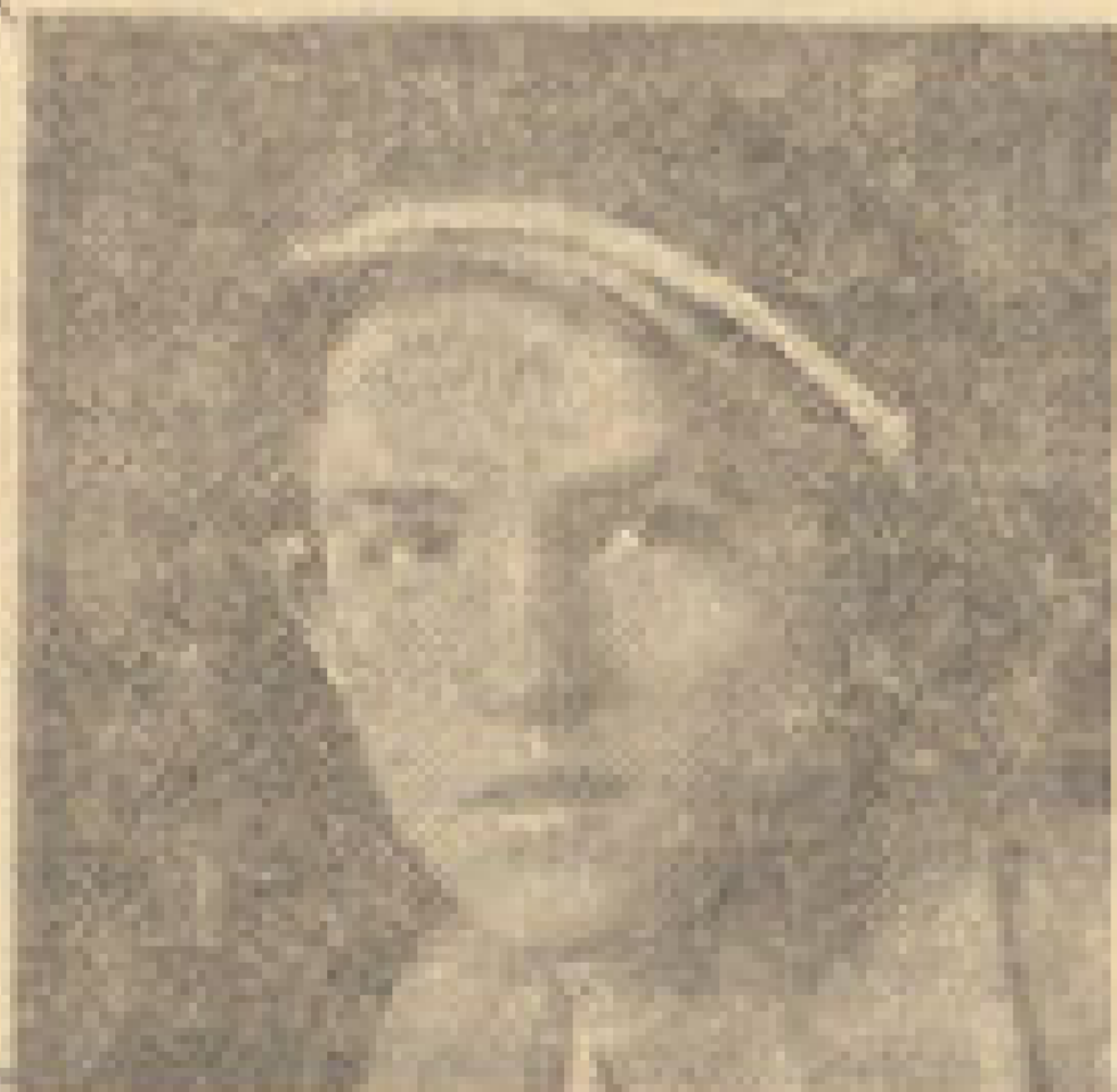
Миленку-Милу 6. Јану Трговачке академије

Тужним срцем и болом у души јављамо свима сродницима, пријате- љима и познаницима, да ћемо нашем незгоди сину