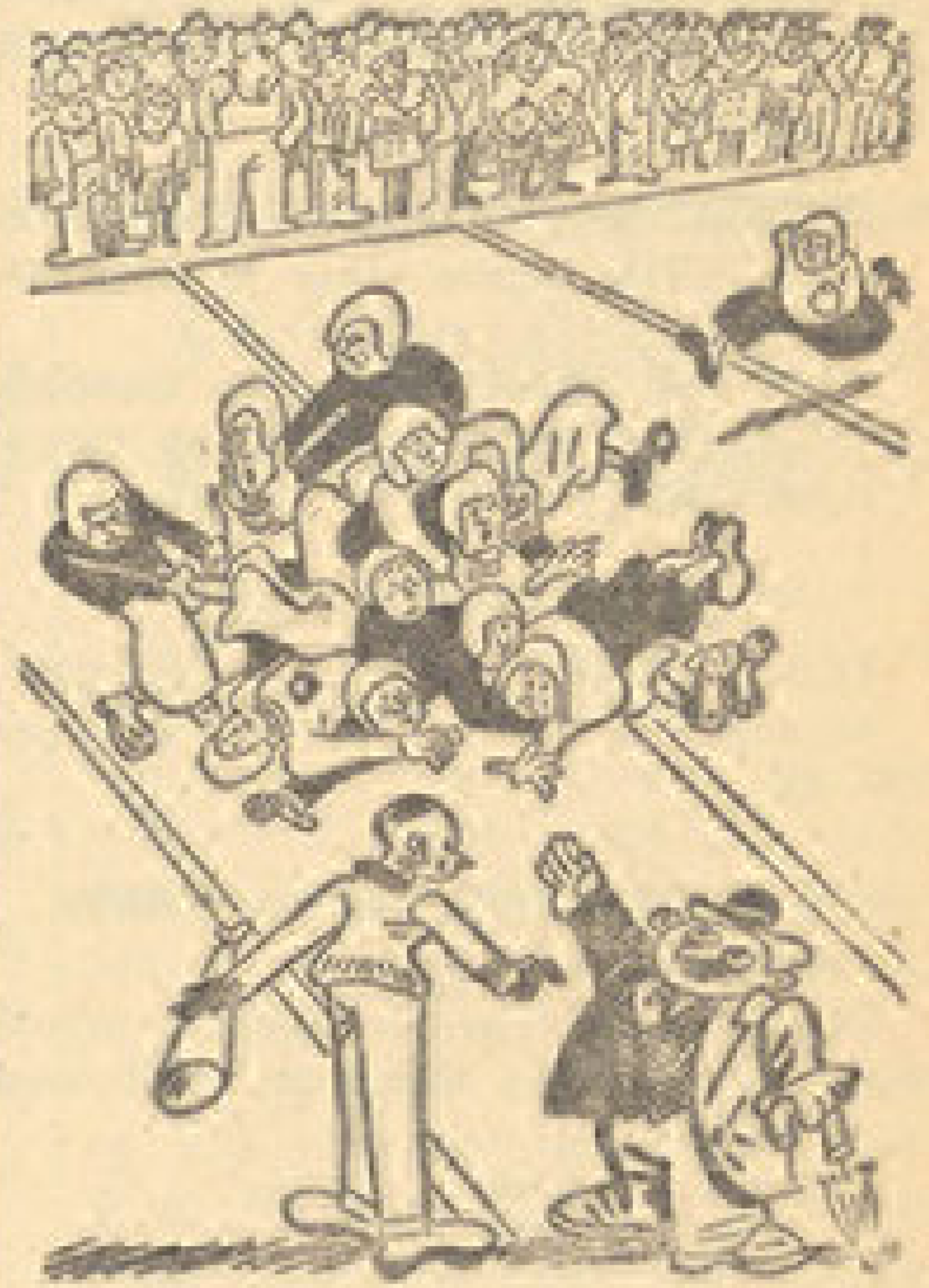
— Тільки деца, а једна лопта! Дреки господине, зашто им не дати још коју?