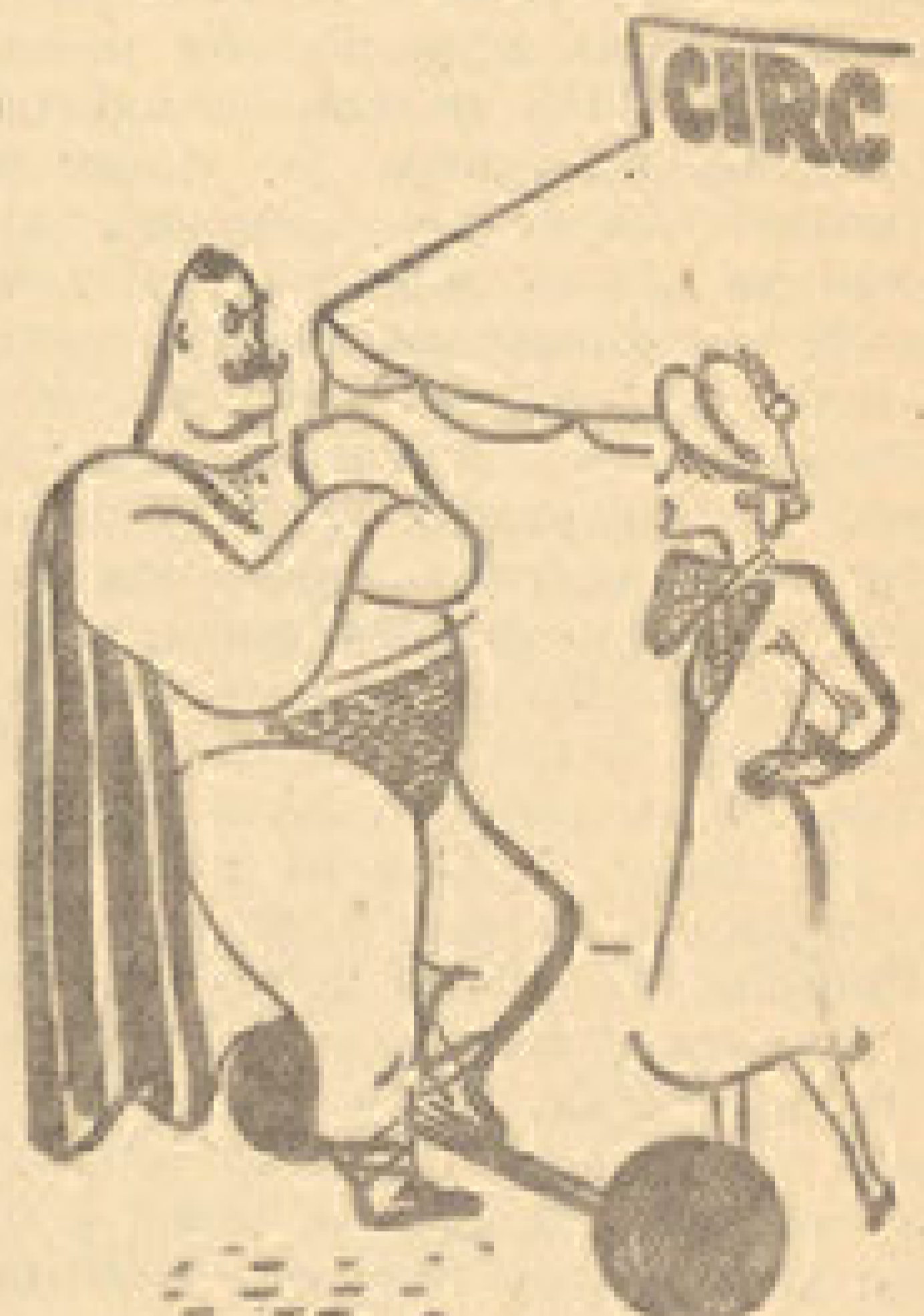
ОНА: Шта? Зар се усуђујете да ми противречите?!

лу, а тешио и врело тело потисло ју је у амбис... Тај човек, говен у ноћи разбухталним страстима, заситио је своја прлава чула расном и поносном лепотом девојке. Мале отргнуто нивше, чије је објине море жвајало. Миланало је и уљуљивало својим тласима њено тело и душу, која је чежула за љубављу мрвог и снажног рибара.