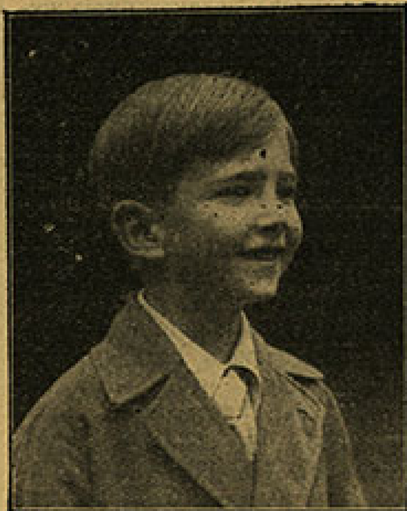
Њ. Вис. Наследник Престола Петар, Старешина Сокола Краљевине Југославије.

А међу њима Соко Краљевине Југославије, полетно, у напону снаге приступа највећем и најлепшем раду,