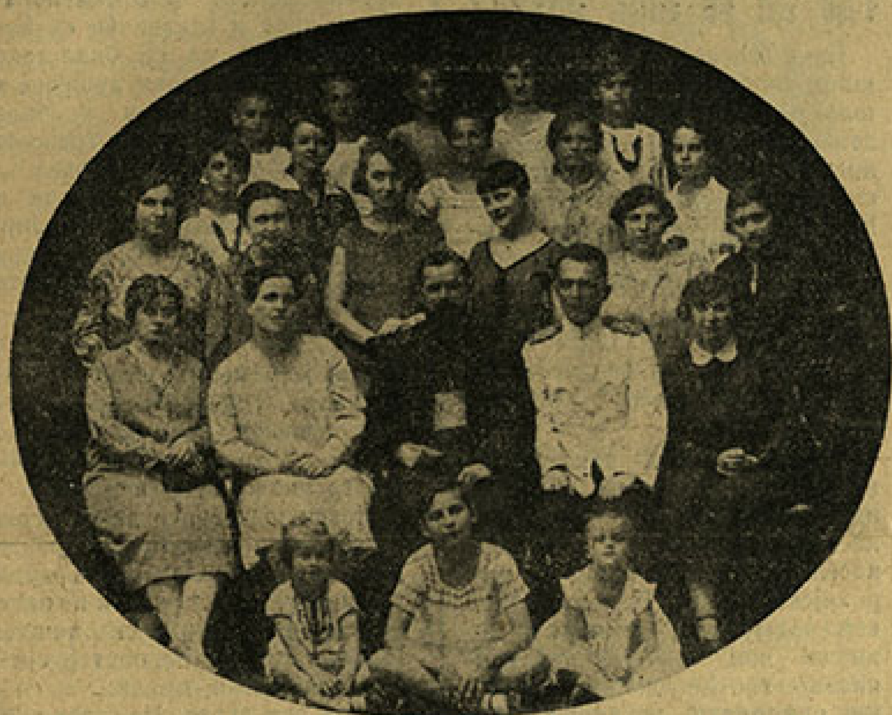
Наставници и ученици Музичке Школе „Бајић“.

приредиће Музичко Друштво низ концерата у Новом Саду и на страни, од којих ће се I Јубиларни Концерт одржати у среду 19. фебруара на вече у „Слободи“. На овом концерту ће први пут осим хора суделовати наставници и ученици Музичке Школе „Бајић“. Програм