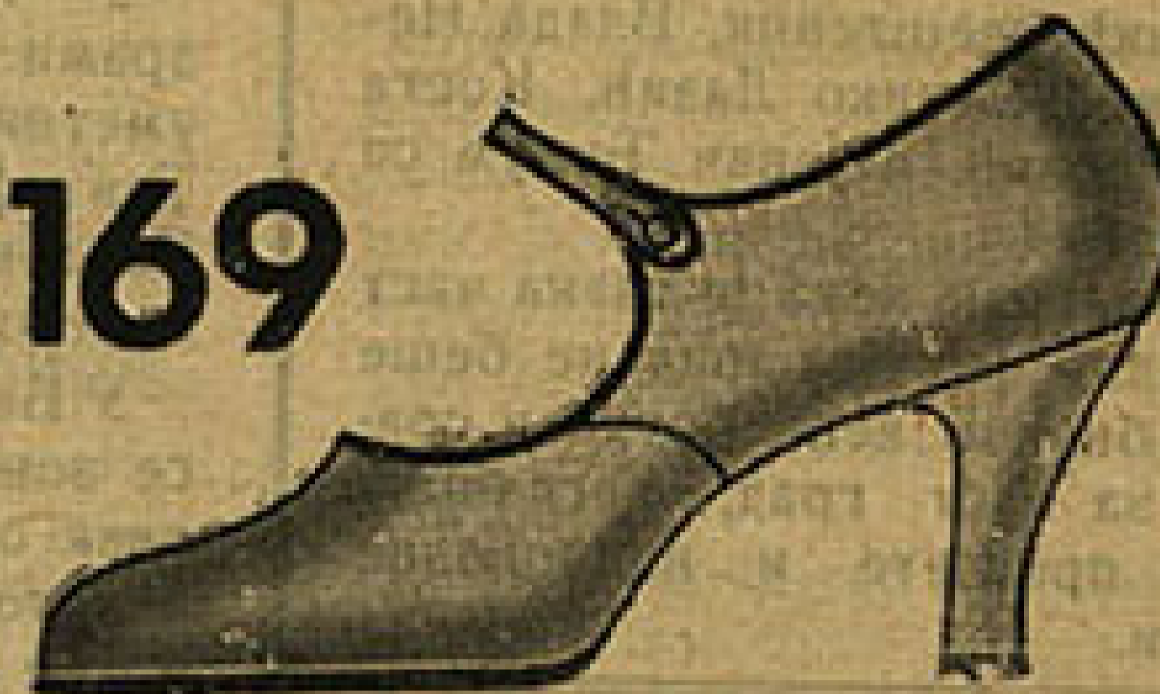
Vrsta 9845 03

Ципеле за сваку згуду, имамо их од лака и шевроа. Врло су једноставне и елегантне. За улицу и за друштво ове ципеле су Вам неопходно потребне.