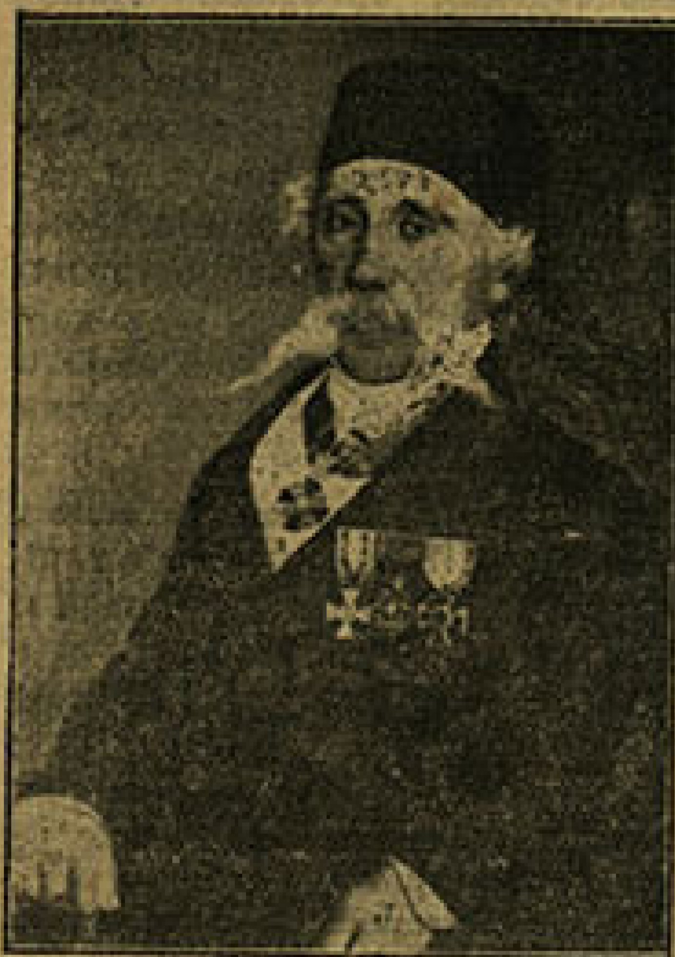
Вук Стефановић Караџић

У селу Тршићу освећује се 17. о. м. Дом Вука Ст. Караџића. Та је свечаност знак пијетета родног места а и целог народа овом великом сину нашег народа.