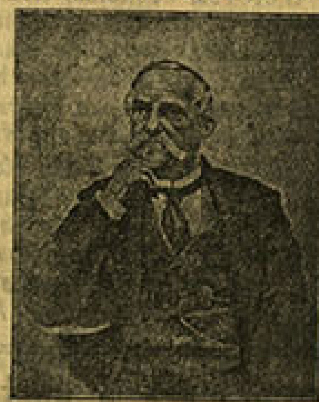
Јован Јовановић Змај

позорницу, својом поезијом води огорчену борбу против свих народних спољних и унутарњих непријатеља наших, он ставља своју песничку лиру у службу наше националне ствари и својим песничким творевинама врши националну пропаганду.