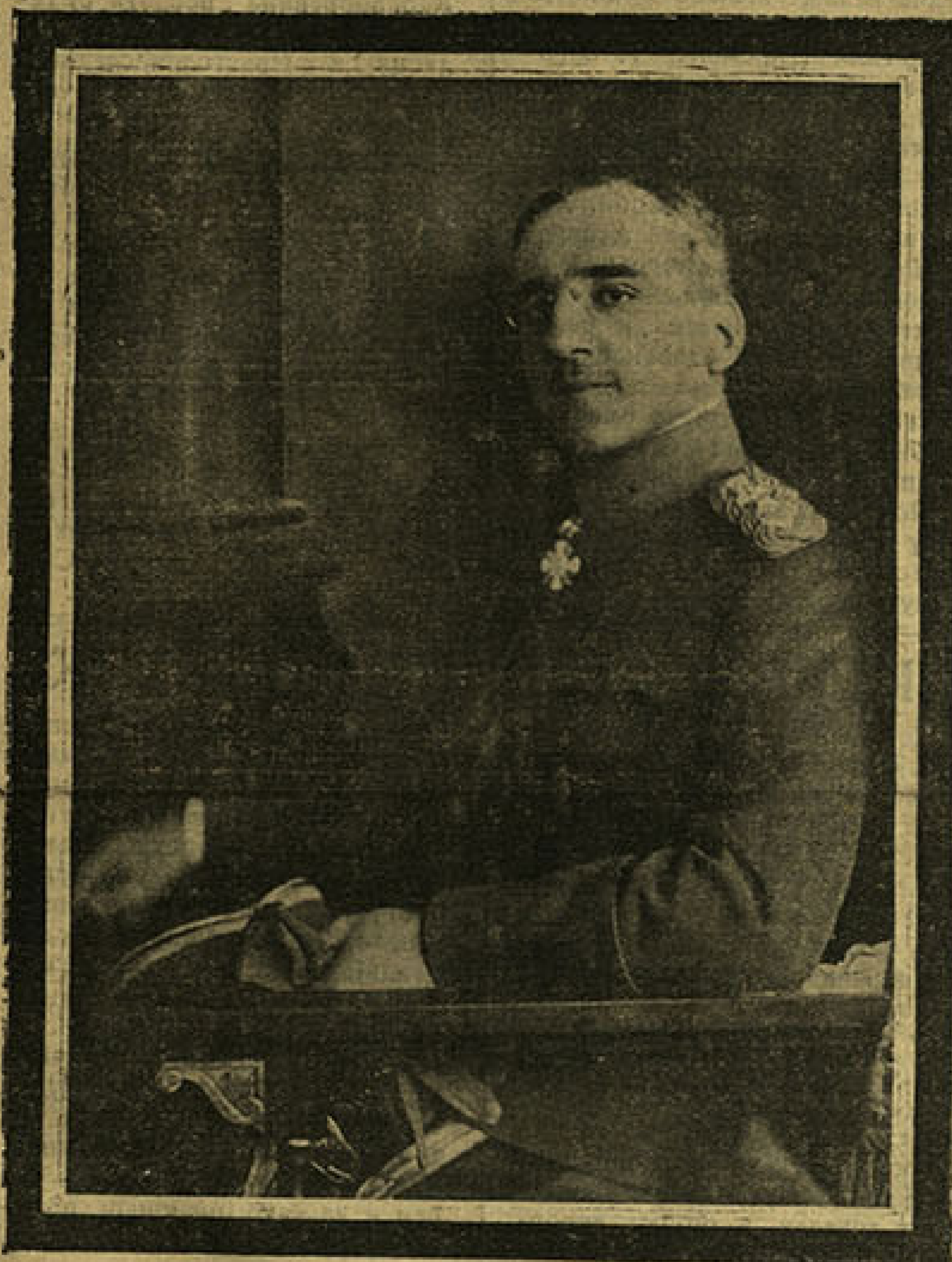
† ВИТЕШКИ КРАЉ АЛЕКСАНДАР ПРВИ УЈЕДИНИТЕЉ

На томе историском делу, на томе оствареном вековном сну свију Југословена, неуморан пионир и највећи поборник и заштитник је био Блаженопочивши Краљ Александар I, који је ради тих неоцењивих заслуга са пуно оправдања прозван Ујединитељем.