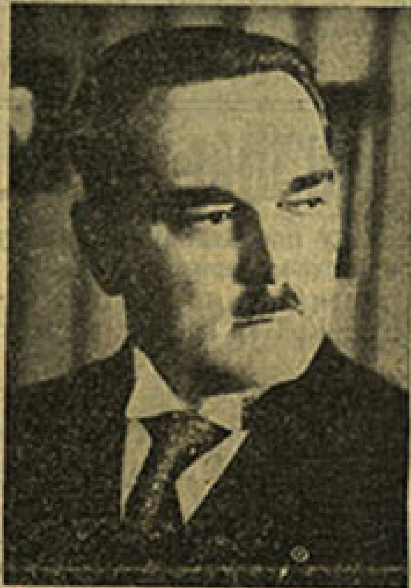
МИЛАН СТОЈАДИНОВИЋ председник Министарског савета