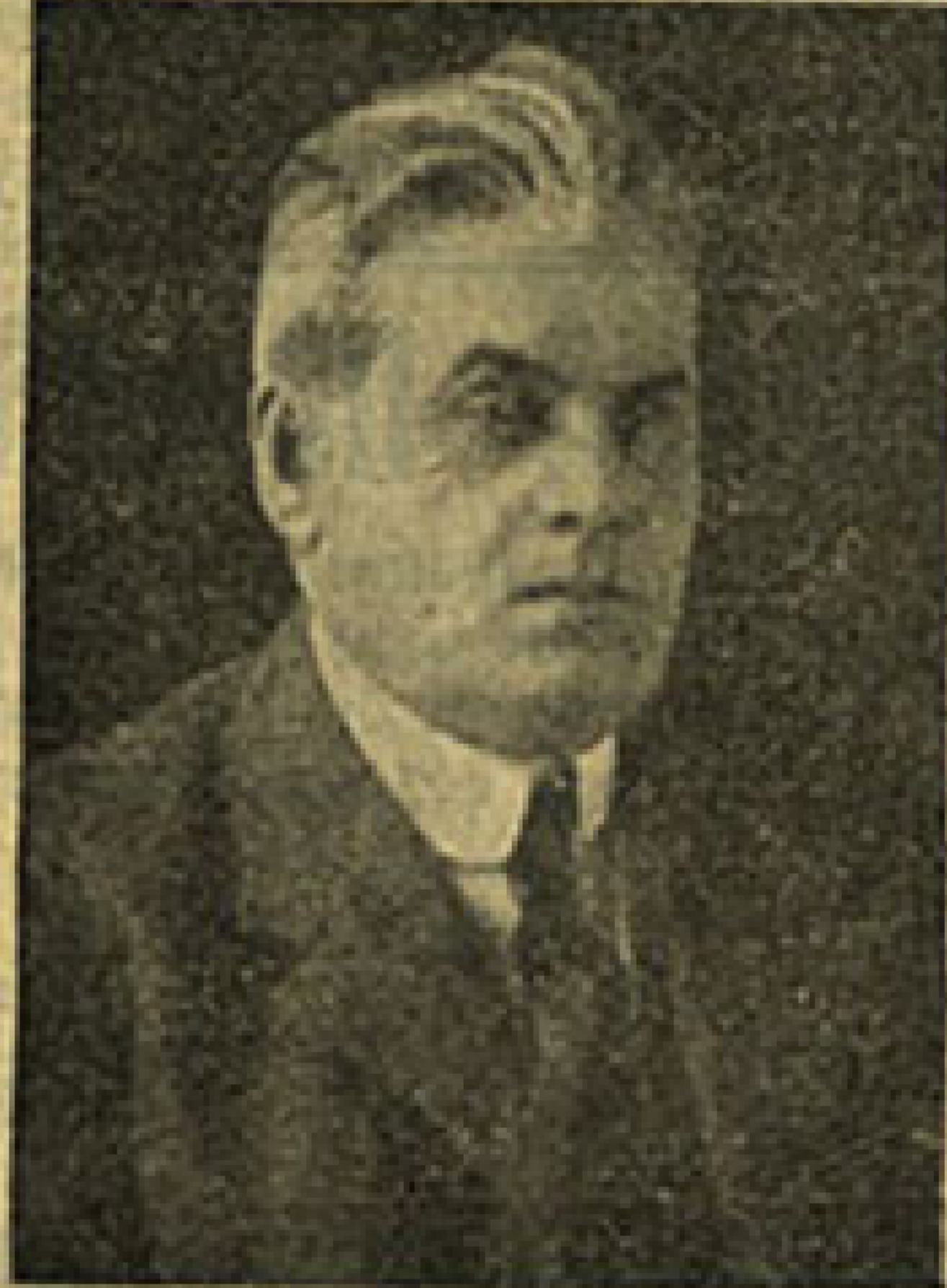
СТЕВАН ЂИРИЋ председник Народне скупштине

Од буџетске дебате у нашој Народној скупштини очекујемо даље нормализовање нашег политичког живота. Партиско-политичко преварање још увек