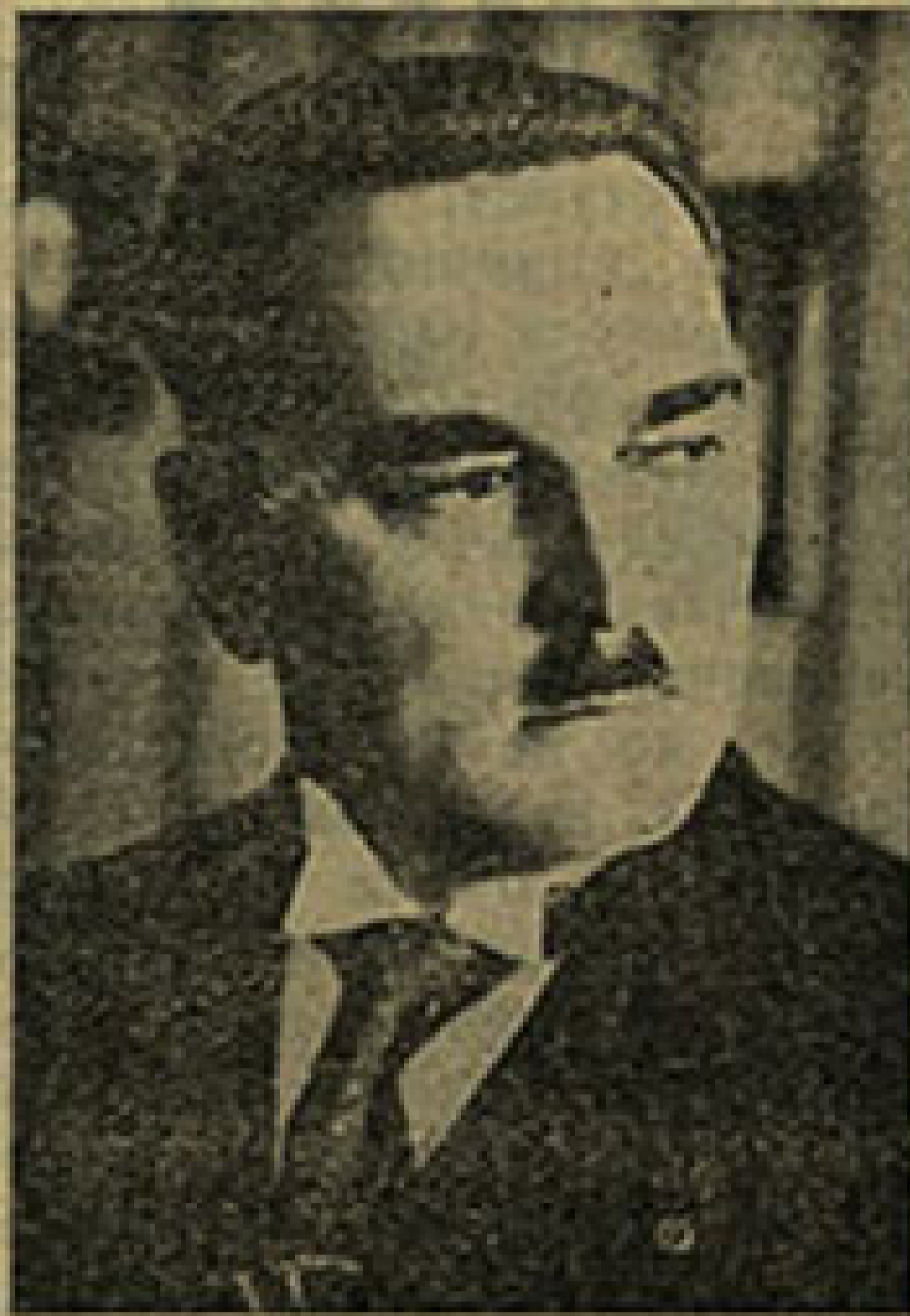
Г. Др. Милан Стојадиновић.

Развој догађаја у нашем унутарњем политичком животу даје могућности за повољна очекивања. Парламентарна ситуација се напokon стабилизовала тако, да је омогућена успешна буџетска дебата у пленуму Народне скупштине, те ће држава на време добити буџет који је у потпуности реалан, јер одговара стварном финансиско-привредном стању и потребама државе.