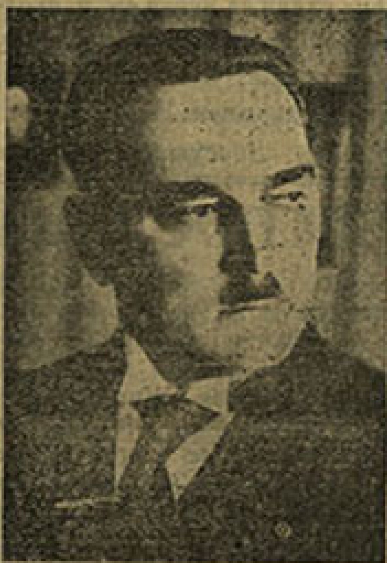
Г. Др МИЛАН СТОЈАДИНОВИЋ

ворна што је дозволила и трпела, да међу њезиним редовима преотму маха најгори елементи, који су физички терор употребљавали као сретство за документовање њиховог политичког и партиског становишта у парламентарном раду, где треба да бриљира наша интелектуална и политичка елита својим говорничким и умним преимућствима. Уместо сјајним беседама и беседничким аргументацијама