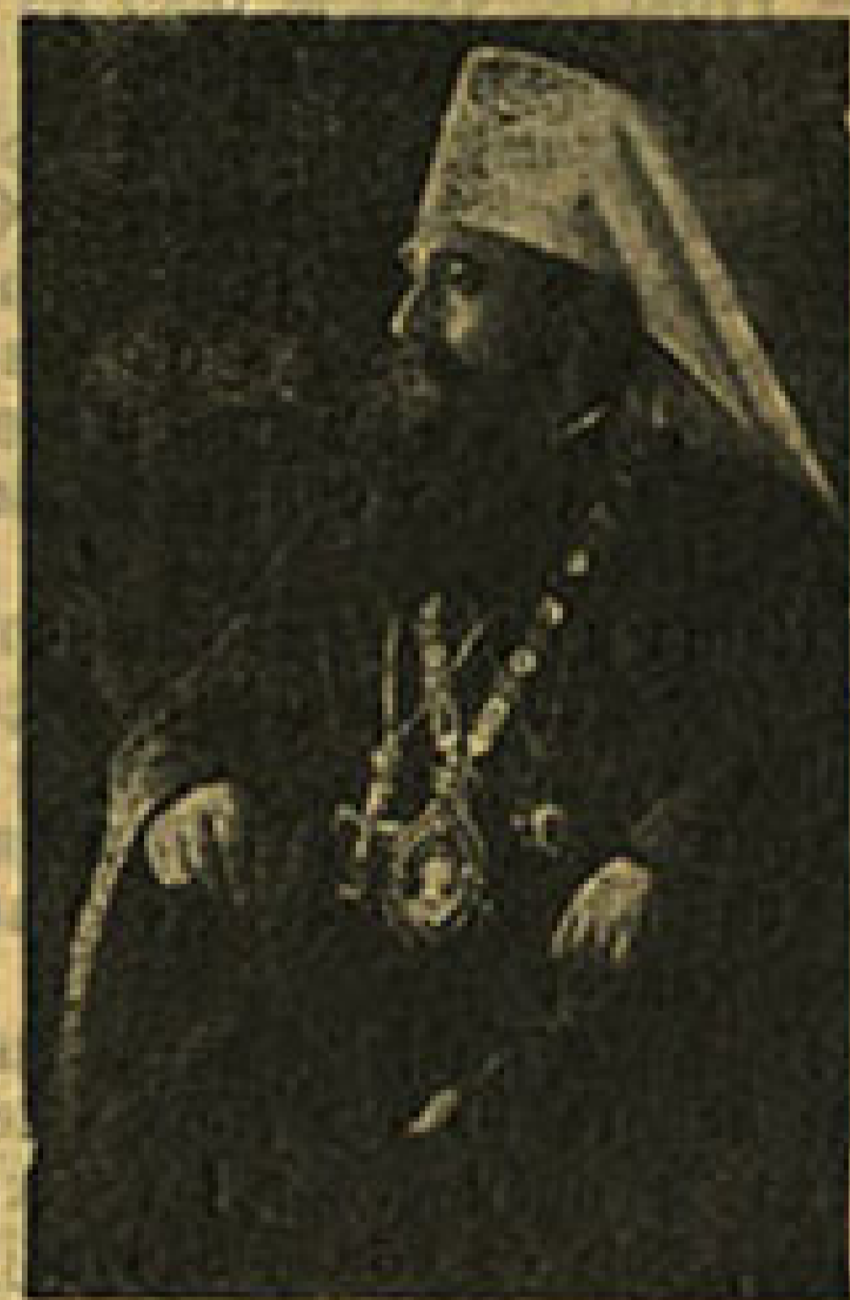
Њ. Св. Патријарх Г. Варнава

У среду 20 јула на позив националних друштава одржано је у Саборној цркви молепствије за оздрављење Њ Светости Патријарха Варнаве. Црква је