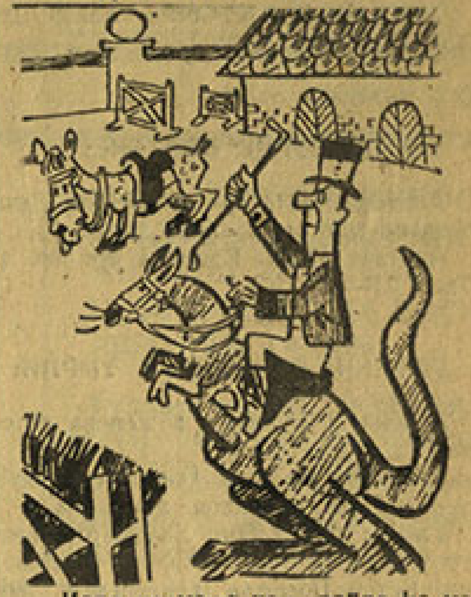
Када не може коњ, ваљда не може ни кенгур!

После неколико дана пацијент је нашао из клинике и био је потпуно здрав.