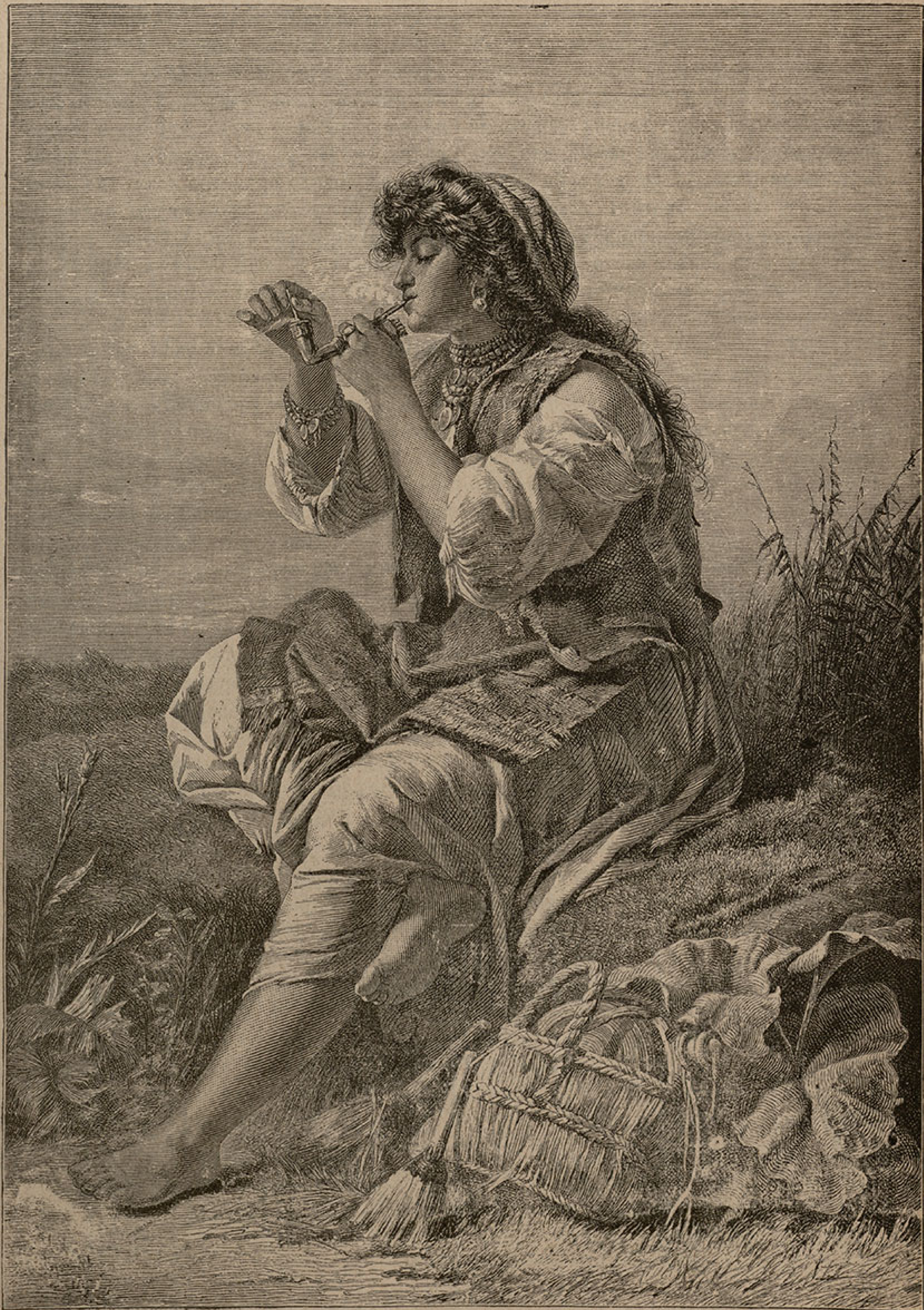
Ци ганка. (Види песму на стр. 41.)