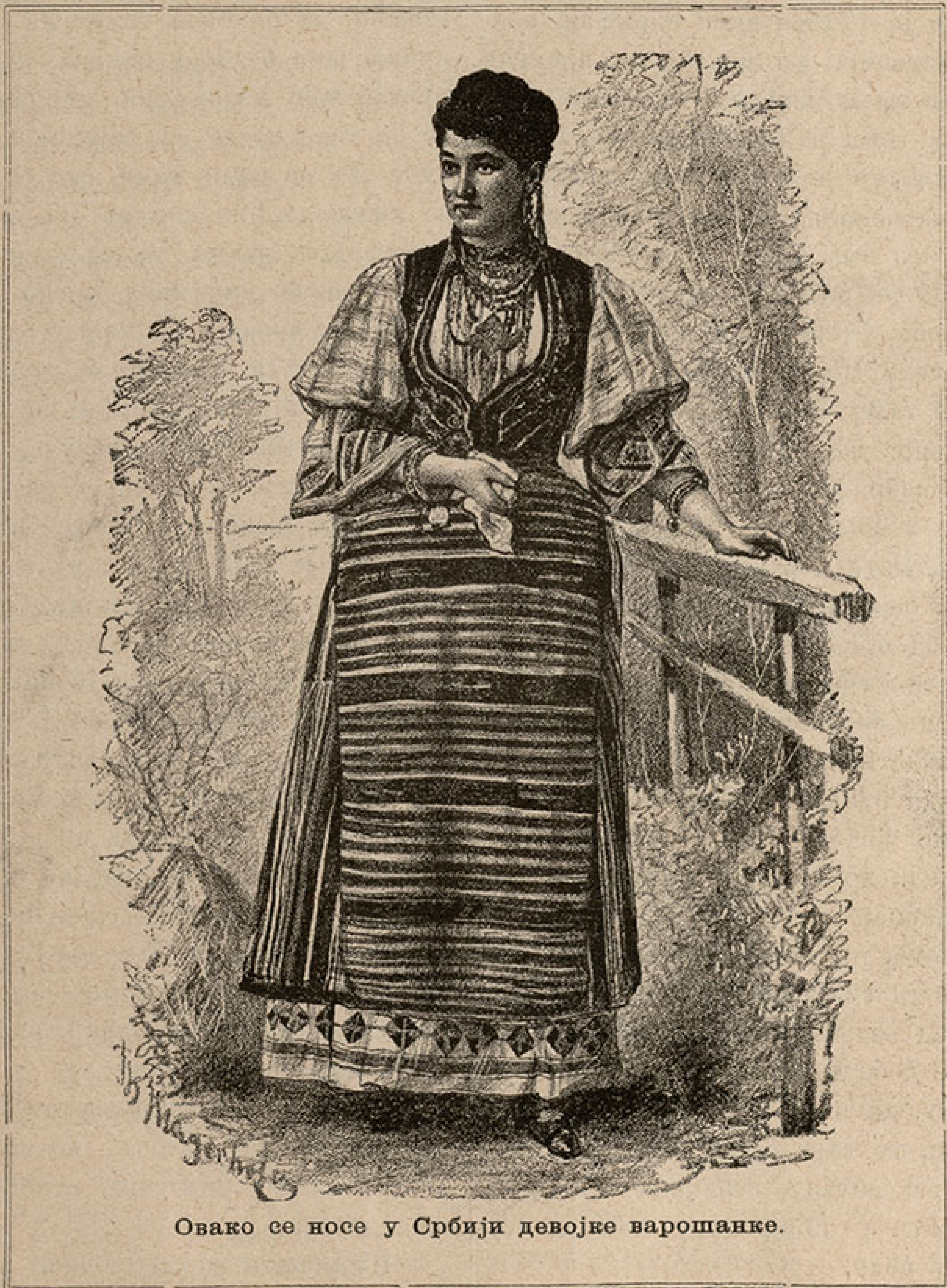
Овако се носе у Србији девојке варошанке.

без лишћа, али пуно цвећа. Свуд по гранама има тога цвећа и сваки се цвет састоји из осам меснатих белих листића. Ако додирнемо само један од тих листића, одмах се скупи и он и сви остали