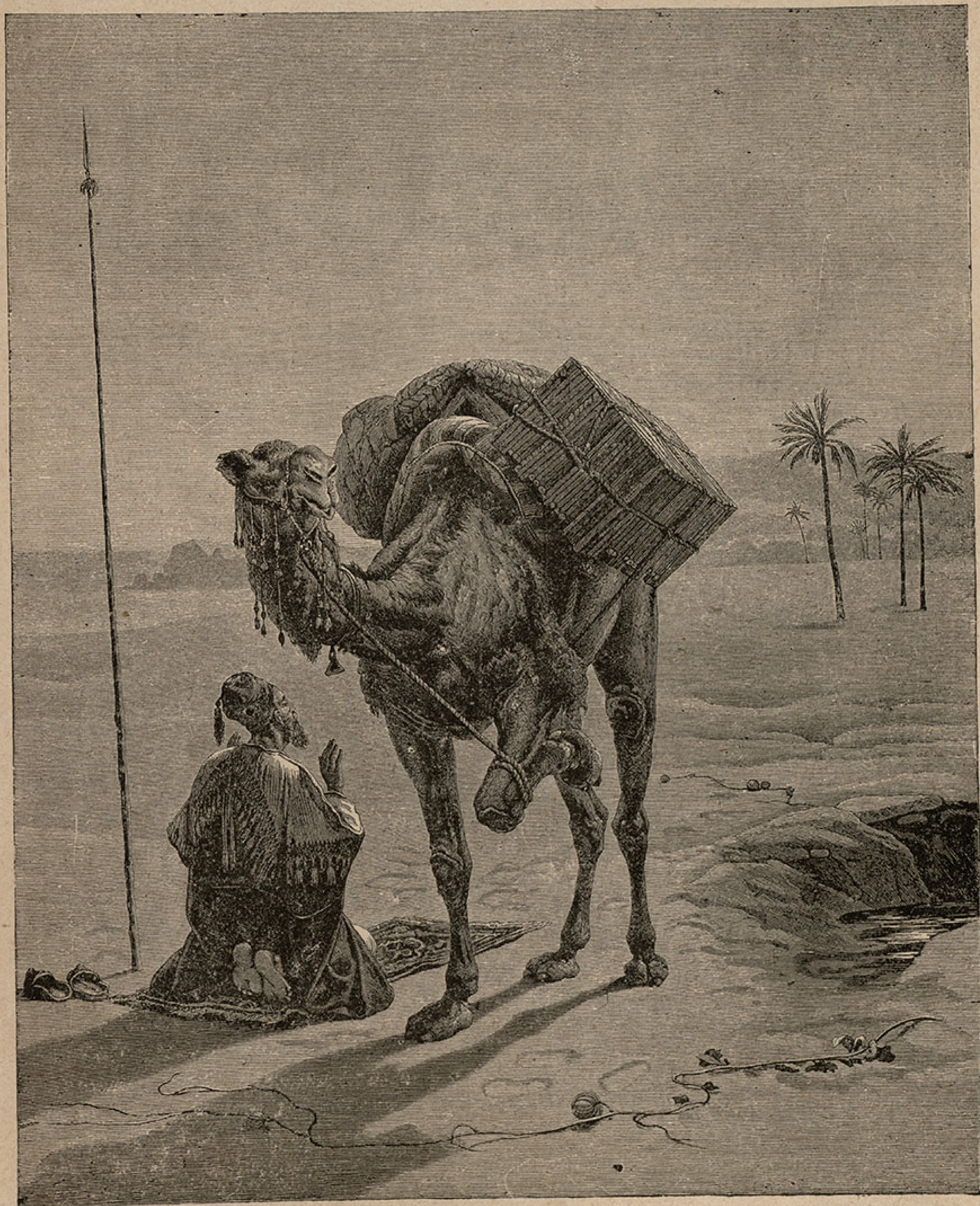
Слике из Арапске: Бедујин на молитви.